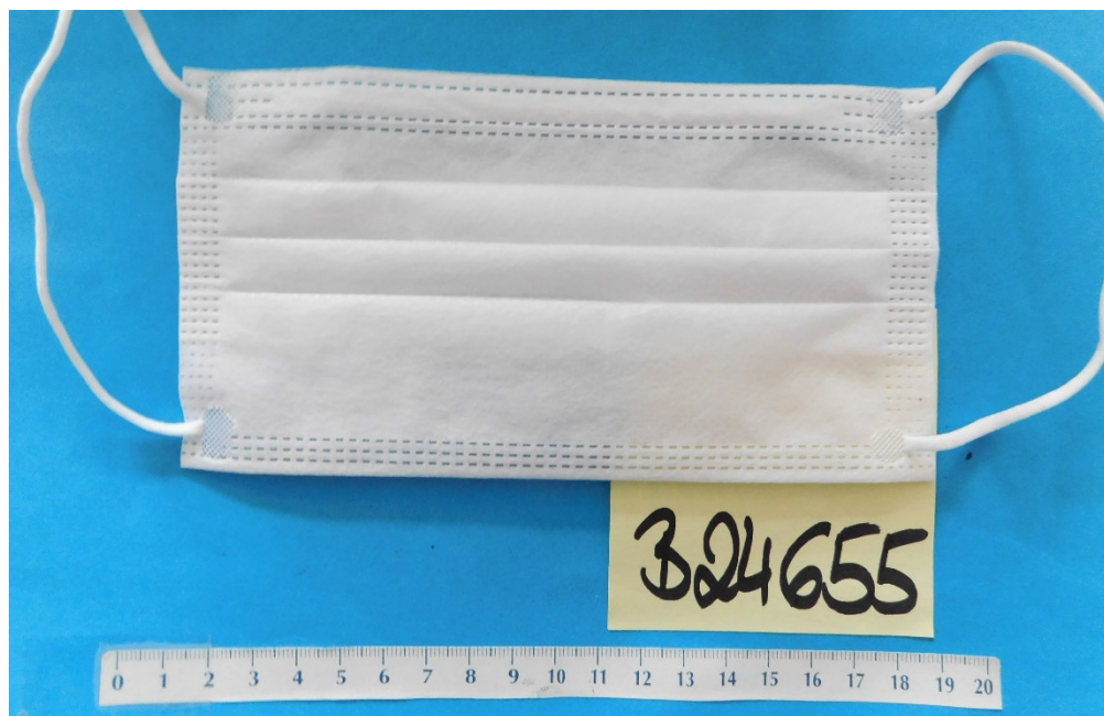
Abb. 1: Face mask with rubber band (Obličejová maska s gumičkou)